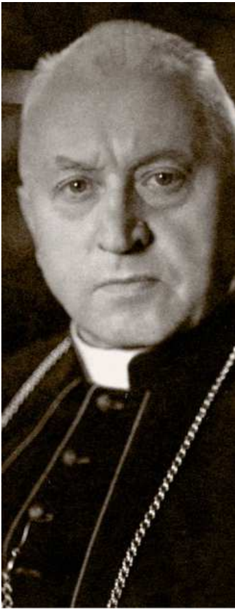
Ksiądz Kardynał August Hlond Prymas Polski 1926-48 Arcybiskup Metropolita Gnieźnieński (1926-48), Poznański (1926-46) i Warszawski (1946-48)