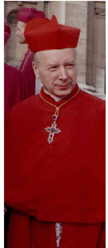
Ksiądz Kardynał Stefan Wyszyński Prymas Polski 1948-81 Arcybiskup Metropolita Gnieźnieński i War- szawski (1948-81)

Przyrzekamy uczynić wszystko, co leży w naszej mocy, aby Polska była rzeczywistym królestwem Twoim i Twojego Syna, poddanym całkowicie pod Twoje