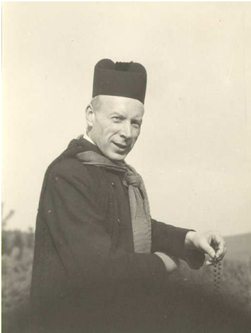
Prymas Tysiąclecia z różańcem

Wzywamy pokornie Twojej pomocy i miłosierdzia w walce o dochowanie wierności Bogu, Krzyżowi i Ewangelii, (...) Przyrzekamy uczynić wszystko, co leży w naszej mocy, aby Polska była rzeczywistym Królestwem Twoim i Twojego Syna, poddanym całkowicie pod Twoje panowanie w życiu naszym osobistym, rodzinnym, narodowym i społecznym.